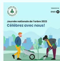
Graphique pour médias sociaux : Instagram