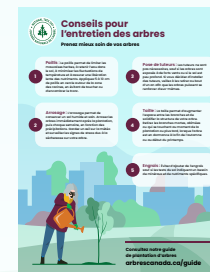
Infographie : Conseils pour l'entretien des arbres