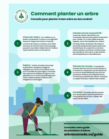
Infographie : Comment planter un arbre