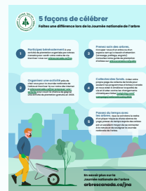
Infographie : 5 façons de célébrer

En plus de faire la promotion de votre événement, Arbres Canada veut donner les moyens aux individus, aux organisations et aux collectivités de cultiver et d'entretenir des espaces verts locaux. Nous avons élaboré des ressources sur la plantation et l'entretien des arbres.